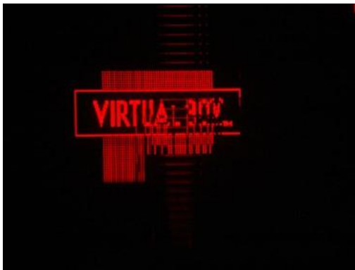
Abbildung 1 Ausfall von halben Bildern