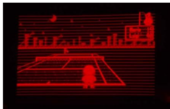
Abbildung 2 Ausfall von einzelnen Linien

Bei dieser Reparatur werden die Flachkabel der Displays mit den Displayplatinen permanent zusammengelötet. Anschließend ist der Kontakt wieder zu 100% gegeben und der/die Fehler sollten behoben sein. Durch das Lötten wird eine dauerhafte Verbindung hergestellt. Daher kommt es zu keinem Fehler mehr, was die Verbindung zum Display betrifft.