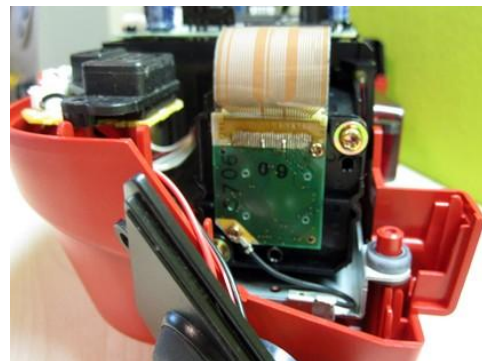
Abbildung 4 Nach erfolgreichem Verlöten des Displayflachkabels

Das optimale Verlöten der beiden Flachkabel kostet 99€ inkl. „Entstaubung“.